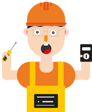
Ο Χαράλαμπος Ηλεκτρολόγος

Οι άγνωστες λέξεις επισημαίνονται με αστεράκι στο κείμενο και οι επεξηγήσεις δίνονται πιο κάτω πάλι με αστεράκι.